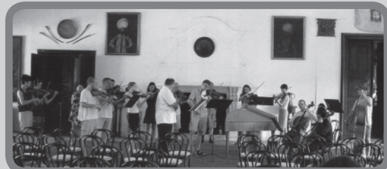
Fellépés előtti próba Vöröskőn

Egy a közös fellépések közül a tanfolyamon résztvevő ifjú zenészekkel, a Pozsonyi Konzervatórium és Pozsonyi Zeneművészeti Egyetem növendékeivel a Tiszti Pavilon dísztermében.