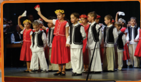
A Tökmagok néptánc csoport