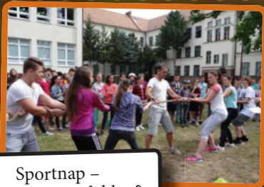
Sportnap – ki húzza a rövidebbet?