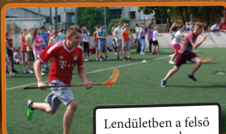
Lendületben a felső tagozatosok