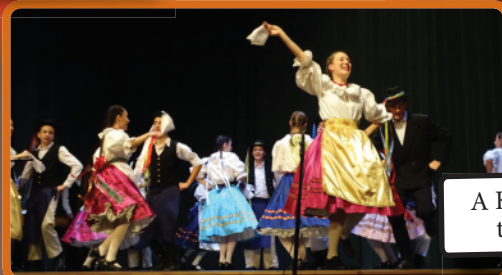
A Kis Zúgó néptánc csoport