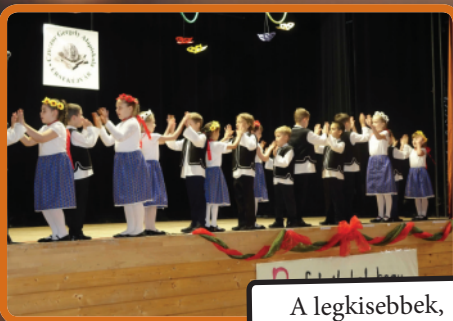
A legkisebbek, a Napraforgók