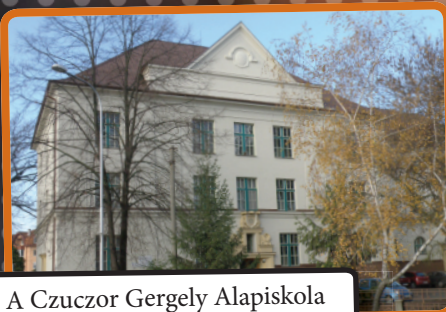
A Czuczor Gergely Alapiskola csaknem százéves épülete