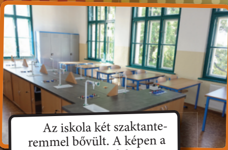
Az iskola két szaktanteremmel bővült. A képen a tavaly átadott labor...