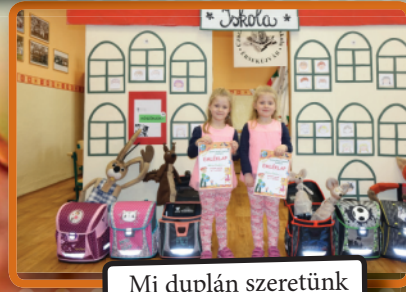
Mi duplán szeretünk iskolába járni!