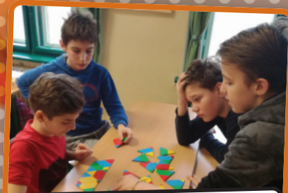
Az elmúlt két évben az ERASMUS+ projekten belül a POLIUNIVERSUM geometriai játékkal tesztelésébe kapcsolódtunk be