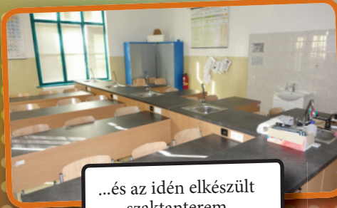
...és az idén elkészült szaktanterem