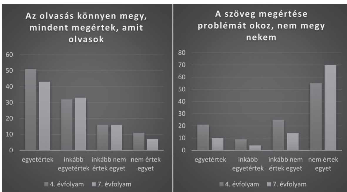
2. ábra: szubjektív véleményen alapuló szövegértési képességek

Az alábbi ábrán (2. ábra) látjuk, hogy a diákok túlnyomó többsége (74%) kortól függetlenül azt vallja, hogy az olvasás könnyen megy számukra (4. évfolyam: 45%, 7. évfolyam: 43%) vagy többnyire mindent (4. évfolyam: 28%, 7. évfolyam: 33%) megértenek, amit olvasnak. Ezzel párhuzamban szintén túlnyomó többségük (59%) teljes mértékben (4. évfolyam: 49%, 7. évfolyam: 70%), néhányuk részben (20%) (4. évfolyam: 22%, 7. évfolyam: 14%) elutasítja azt az állítást, mely szerint a szöveg megértése problémát okoz neki.