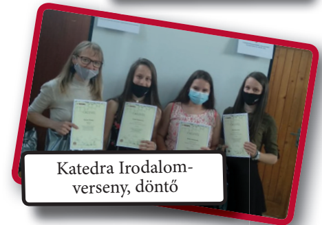
Katedra Irodalom-verseny, döntő