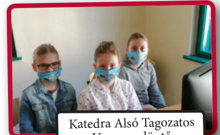
Katedra Alsó Tagozatos Verseny, döntő