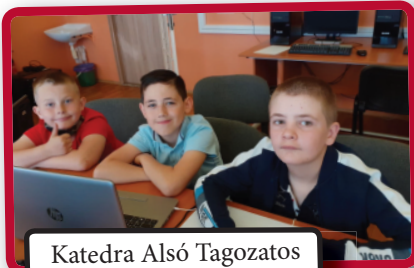
Katedra Alsó Tagozatos Verseny, döntő