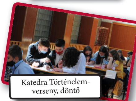
Katedra Történelem-verseny, döntő