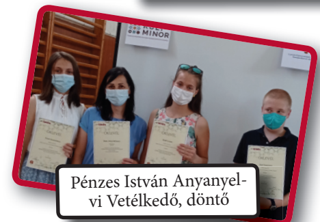
Pénzes István Anyanyelvi Vetélkedő, döntő