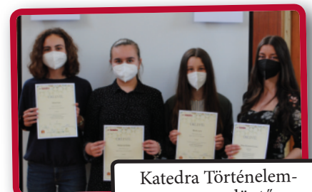
Katedra Történelem-verseny, döntő