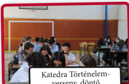
Katedra Történelem-verseny, döntő