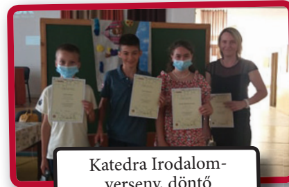
Katedra Irodalom-verseny, döntő