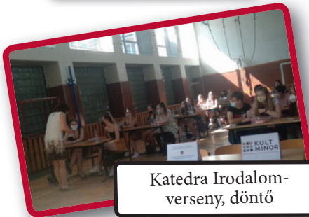
Katedra Irodalom-verseny, döntő