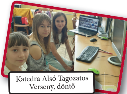
Katedra Alsó Tagozatos Verseny, döntő