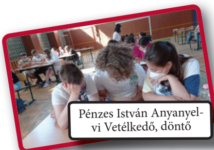
Pénzes István Anyanyelvi Vetélkedő, döntő