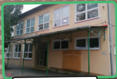
Az alsó tagozat épülete