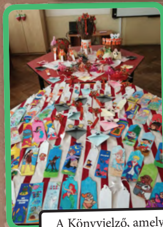
A Könyvjelző, amely összeköt c. projekt