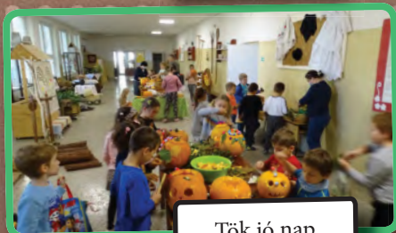
Tök jó nap