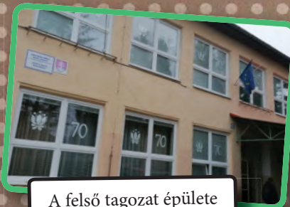
A felső tagozat épülete