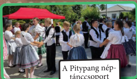
A Pitypang néptáncscsoport