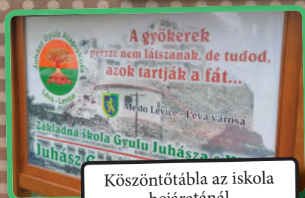
Köszöntőtábla az iskola bejáratánál