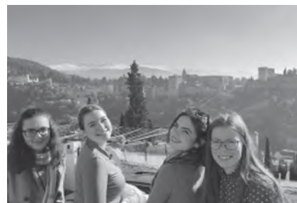
Alhambra a háttérben