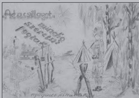
▲ 4. kép: Apám személyes adatai a világhálón ▼ 5. kép: „Az a csillagot...”