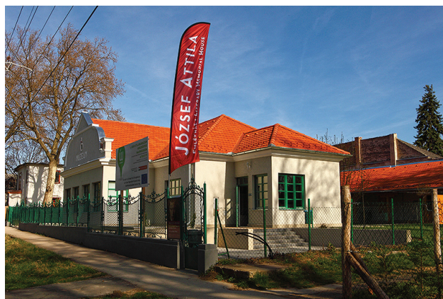
| A balatonszársói József Attila Emlékhely.

Az 1960-as és 1970-es években alapított irodalmi emlékházaink újszerűségükkel kezdetben sok látogatót vonzottak. Az irodalmi kánon átalakulásával, az olvasói szokások és a befogadás változásával az érdeklődés a nyolcvanas évektől jelentősen csökkent irántuk. A 1990-es évektől tragikussá vált a helyzet, az emlékházak látogatottsága radikálisan visszaesett. Az épületek egyre rosszabb állapotba kerültek, a kiállítások gyakran tartalmilag is elavultak, vizuálisan elfáradtak, s már nem tudták többé reprezentálni jelentőségüket. Az emlékhelyek fenntartói, felelősei – helyi önkormányzatok, megyei múzeumok – próbálták menteni a menthetőt. A Petőfi Irodalmi Múzeum alapítása óta szakmai felügyeletet gyakorol az ország irodalmi emlékhelyei fölött, és jó ideje jelezte már a kulturális tárcának, hogy a házak és a kiállítások többsége komoly felújításra szorul. Nyilvánvaló volt, ha meg akarjuk állítani a további látogatószám-csökkenést, komoly anyagi és szellemi anyagi beruházást kell végrehajtani. Ha nem történnek változások, elveszíthetjük kulturális tradícióknak ezt a különleges szegmensét. Emlékházanként megvizsgáltuk, hogy annak az életműve, akinek emléket állítottak örökérvényű