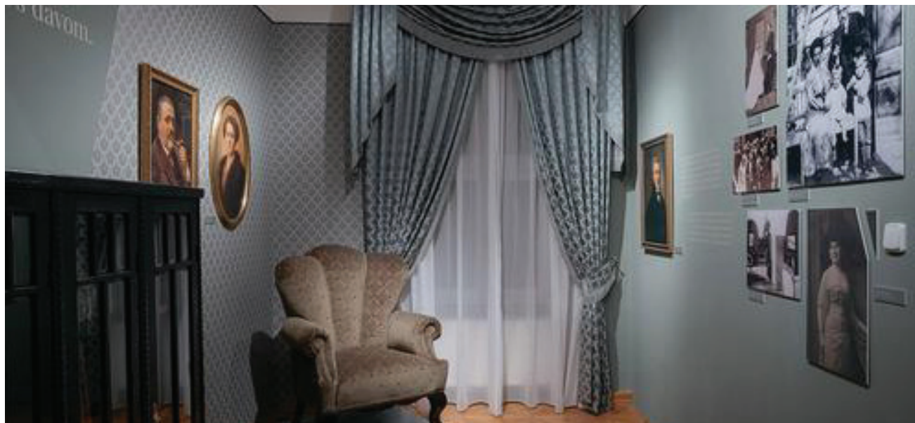
| Részlet a kassai Márai Sándor Emlékiállításból