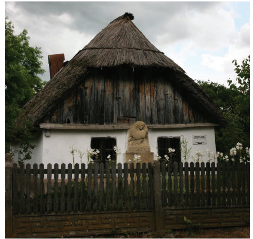
| Ady Endre szülőháza Érmindszenten