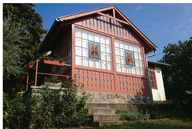
| Babits Mihály Emlékház Esztergomban

zeumpedagógiai füzet és klasszikusokat kortárs szerzőkkel párbeszédbe hozó kötet is megjelent. 6 A látogatószám dinamikusan emelkedett. 7 A számszerűsíthető eredmények mellett kiemelésre érdemesek azok a minőségi változások és tendenciák, amelyek a megvalósítás során értünk el. A legfontosabb eredmény, hogy fordulat történt az irodalmi kiállításokról való gondolkodásban: a korábban irodalomtörténeti-életrajzi vagy kultusztörténeti megközelítést felváltotta az irodalmat művészetként is értelmező felfogás. A kultuszkutatás eredményeit a kurátorok úgy tudták beépíteni a koncepciójukba, hogy az a befogadás komplexitását eredményezte. Az új kiállítások mindegyikére jellemző a módszertani tudatosság már a tervezési időszakban is. A koncepciók változatosak, a 21. századi muzeológiai kihívásokra úgy válaszoltak, hogy közben az irodalomtudomány eredményeit is integrálták a maguk rendszerébe. Úgy „populárisak”, hogy mindegyik mögött komoly tudományos megalapozottság van, mégis élményszerűek. A múzeumpedagógiai kutatások és tapasztalatok eredményeinek felhasználása is természetessé vált a tervezéskor és az üzemeltetés időszakában. Az emlékházakban dolgozó kollégák munkáját ez jelentősen megkönnyítette.