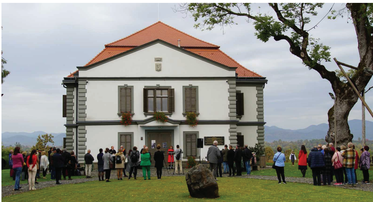
| A „Sorsom megáldott boldog szerelimmal.” Szendrey Júlia és Petőfi Sándor mézeshetei Koltón című kiállítás megnyitója, 2023. október 20.

az emlékezet élő színtereivé, ha a helyi közösség is a magáénak érzi, ha egy idegenvezető éppen olyan szívesen viszi el ezekre a helyekre a legkülönbébb érdeklődésű és korosztályú csoportjait, mint ahogy egy tanár a diákjait, ha a családok is megtalálják a kulturált szórakozás lehetőségét.