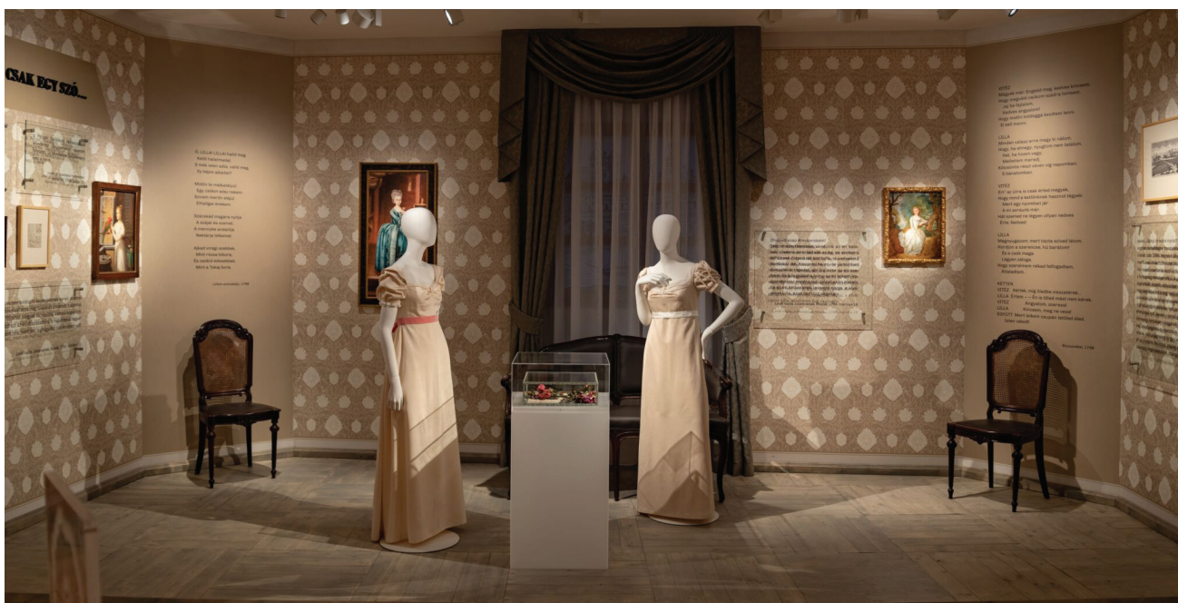
| Részlet a csurgói „Legalább álmodj velem” című Csokonai-kiállításból, 2019

zeumpedagógiai füzet és klasszikusokat kortárs szerzőkkel párbeszédbe hozó kötet is megjelent. 6 A látogatószám dinamikusan emelkedett. 7 A számszerűsíthető eredmények mellett kiemelésre érdemesek azok a minőségi változások és tendenciák, amelyek a megvalósítás során értünk el. A legfontosabb eredmény, hogy fordulat történt az irodalmi kiállításokról való gondolkodásban: a korábban irodalomtörténeti-életrajzi vagy kultusztörténeti megközelítést felváltotta az irodalmat művészetként is értelmező felfogás. A kultuszkutatás eredményeit a kurátorok úgy tudták beépíteni a koncepciójukba, hogy az a befogadás komplexitását eredményezte. Az új kiállítások mindegyikére jellemző a módszertani tudatosság már a tervezési időszakban is. A koncepciók változatosak, a 21. századi muzeológiai kihívásokra úgy válaszoltak, hogy közben az irodalomtudomány eredményeit is integrálták a maguk rendszerébe. Úgy „populárisak”, hogy mindegyik mögött komoly tudományos megalapozottság van, mégis élményszerűek. A múzeumpedagógiai kutatások és tapasztalatok eredményeinek felhasználása is természetessé vált a tervezéskor és az üzemeltetés időszakában. Az emlékházakban dolgozó kollégák munkáját ez jelentősen megkönnyítette.