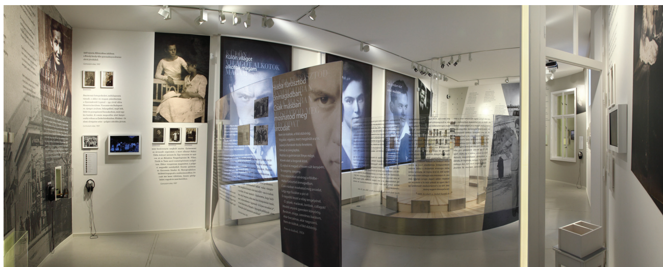
| Részlet a Gát utcai „Eszmélet” című, József Attila-kiállításból. A kiállítás 2016-ben elnyerte az Év Kiállítása címet.