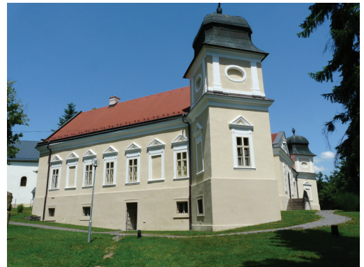
| Madách Emlékmúzeum, Alsósztregova