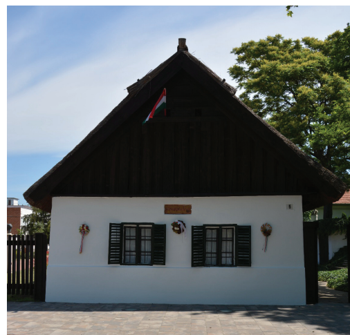
| Petőfi Sándor szülőháza Kiskőrösön

A projekt nagyszabású változásokat indított el. A hétéves periódusban 64 emlékház közül 23-at újítottunk fel egészben vagy részben. Olyan épületeket hoztunk rendbe, amelyeknél az elmúlt 20–30 évben állagmegóvásra is alig került sor. Az új kiállítások megépítésével sikerült az emlékházak kiállítások átlagéletkorát 22 évről 7 évre leszorítani. Ötven kolléga húsz alkalommal vett részt a továbbképzéseinken, 200 gyermek számára szerveztünk olvasótábort emlékházakhoz. Minden házhoz készítettünk azonos grafikai arculattal egy 12 oldalas kiadványt, angol nyelvű rövid összefoglalóval. Két mű-