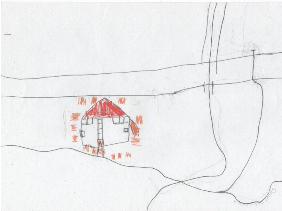
Egy autista gyermek rajza