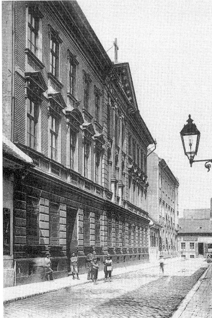
Szent Margit Kórház 1912

„... minden beszélgetés előtt selyempapírral borították be a telefonkagylót.”