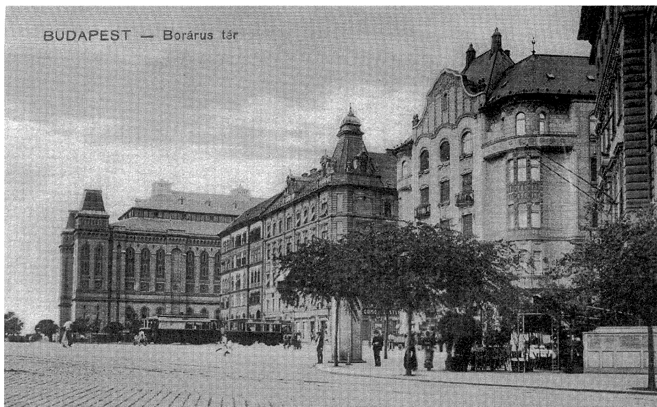
Boráros tér 1913

„Hamarosan zsír- és húshiány alakult ki, a vendéglőkben heti egy hústalan és zsírtalan napot vezettek be.”