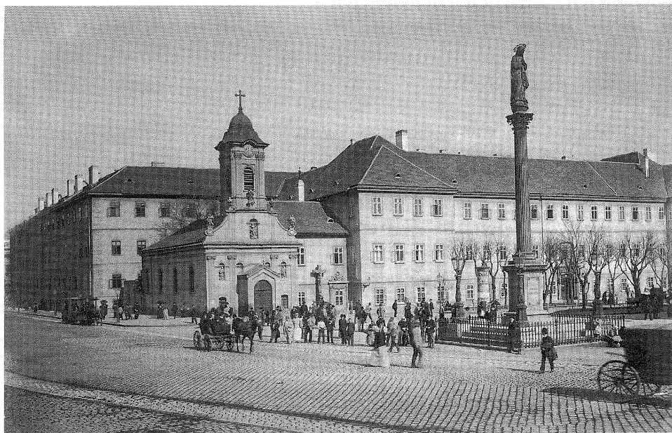
A Rókus Kórház 1890-es évek

„... nyár folyamán feltűnően megnőtt a halálos kimenetelű tüdőgyulladások, mellhártyagyulladások száma.”