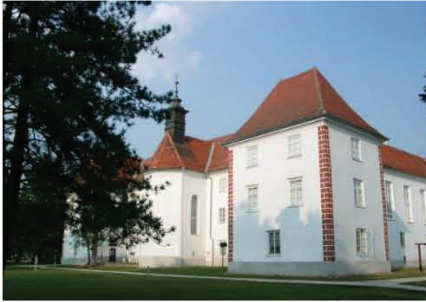
E – Muraszombati (Szapáry-kastély)