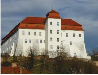
C – Lendvai vár