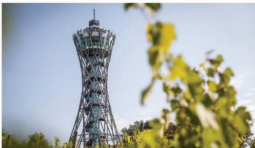
A – Vinarium Tower