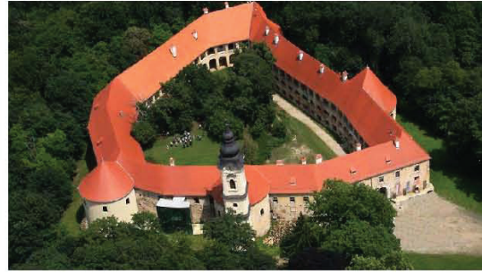
D – Grad kastély